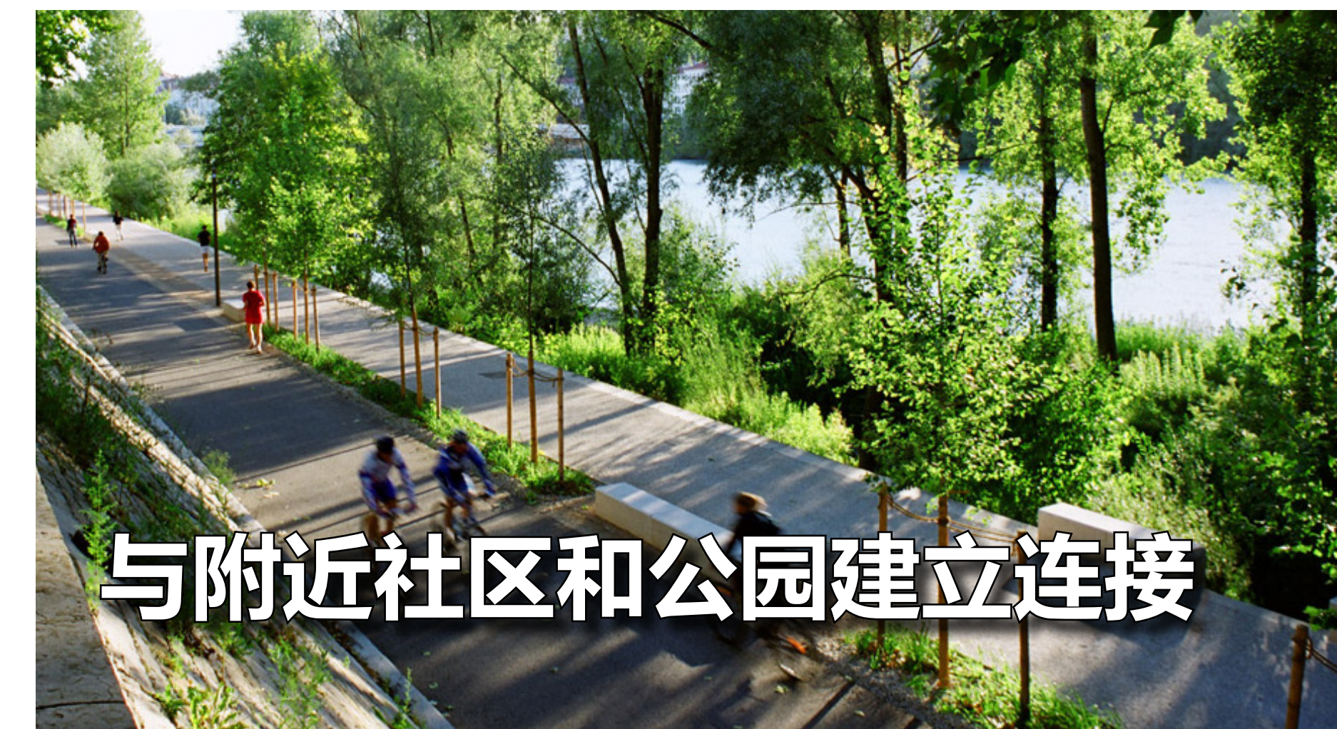
与附近社区和公园建立连接