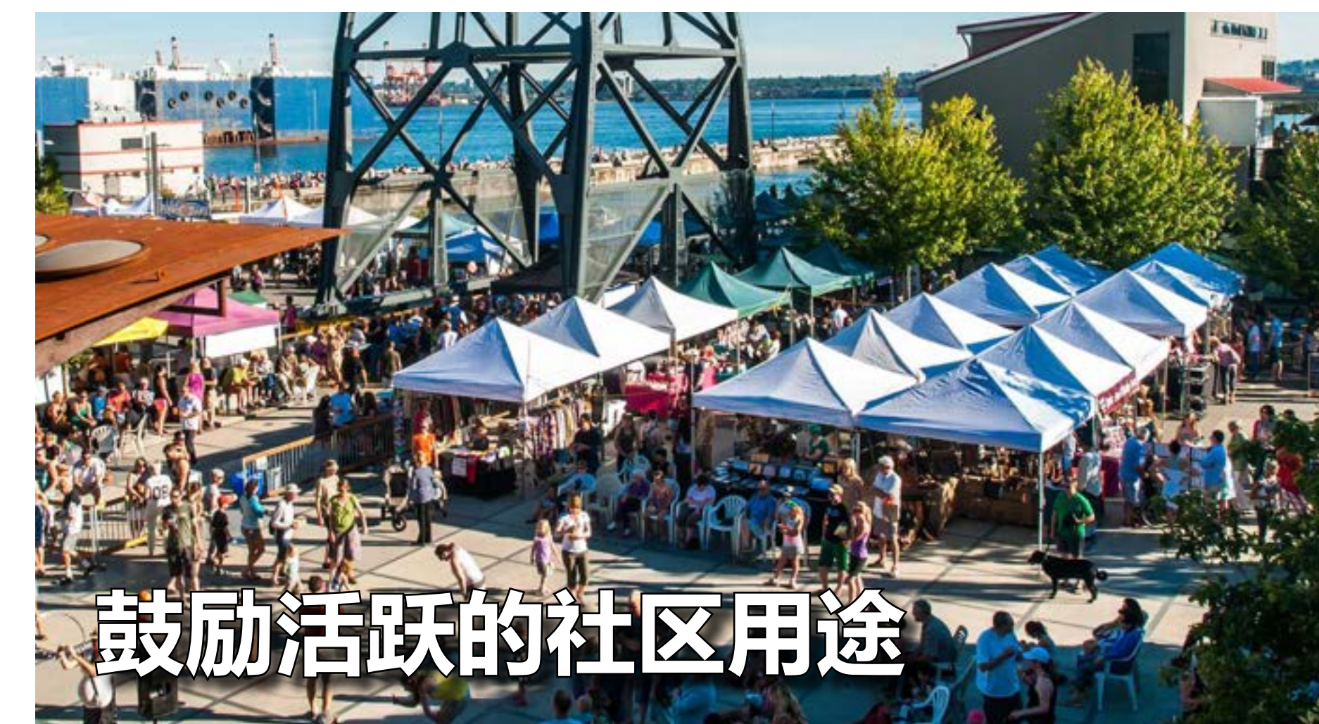
鼓励活跃的社区用途