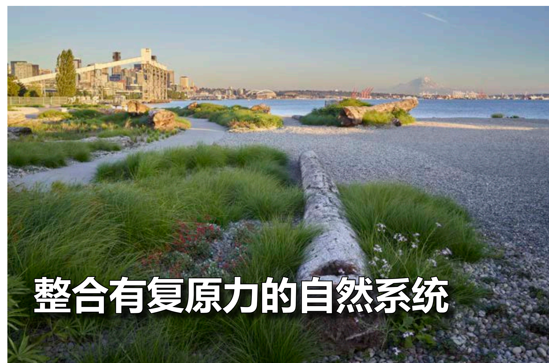
整合有复原力的自然系统