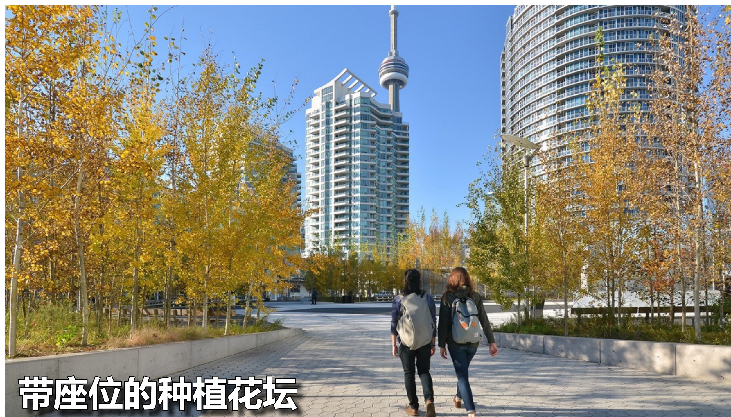
带座位的种植花坛