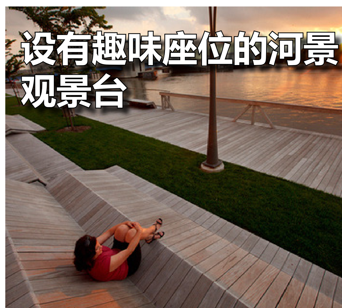
设有趣味座位的河景 观景台