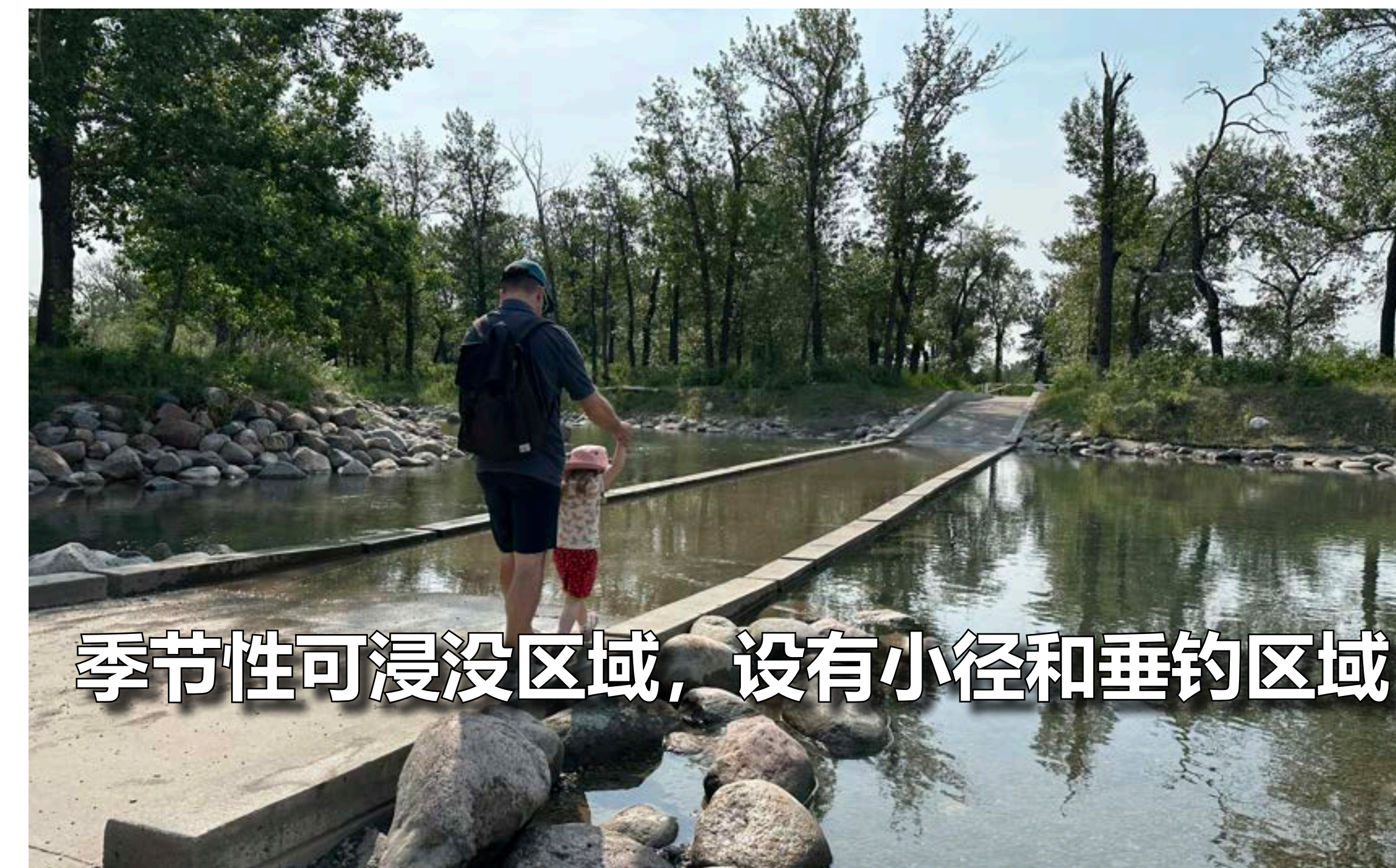
季节性可浸没区域，设有小径和垂钓区域