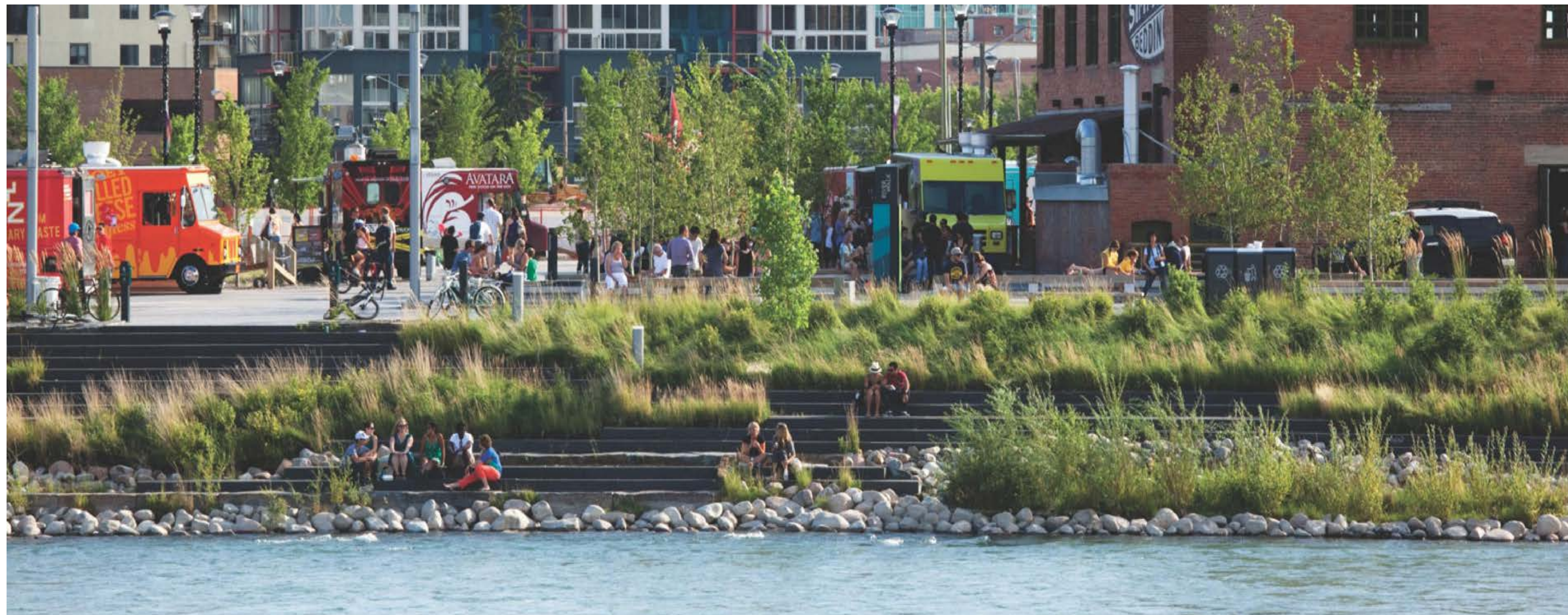
Photograph showing the Bow RiverWalk in downtown Calgary with people sitting on concrete steps near the river. Native vegetation and river rock line the riverside and are intermingled with the steps.