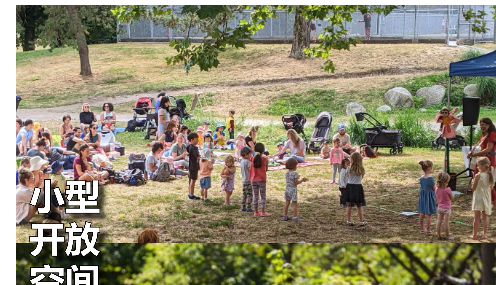
小型 开放 空间