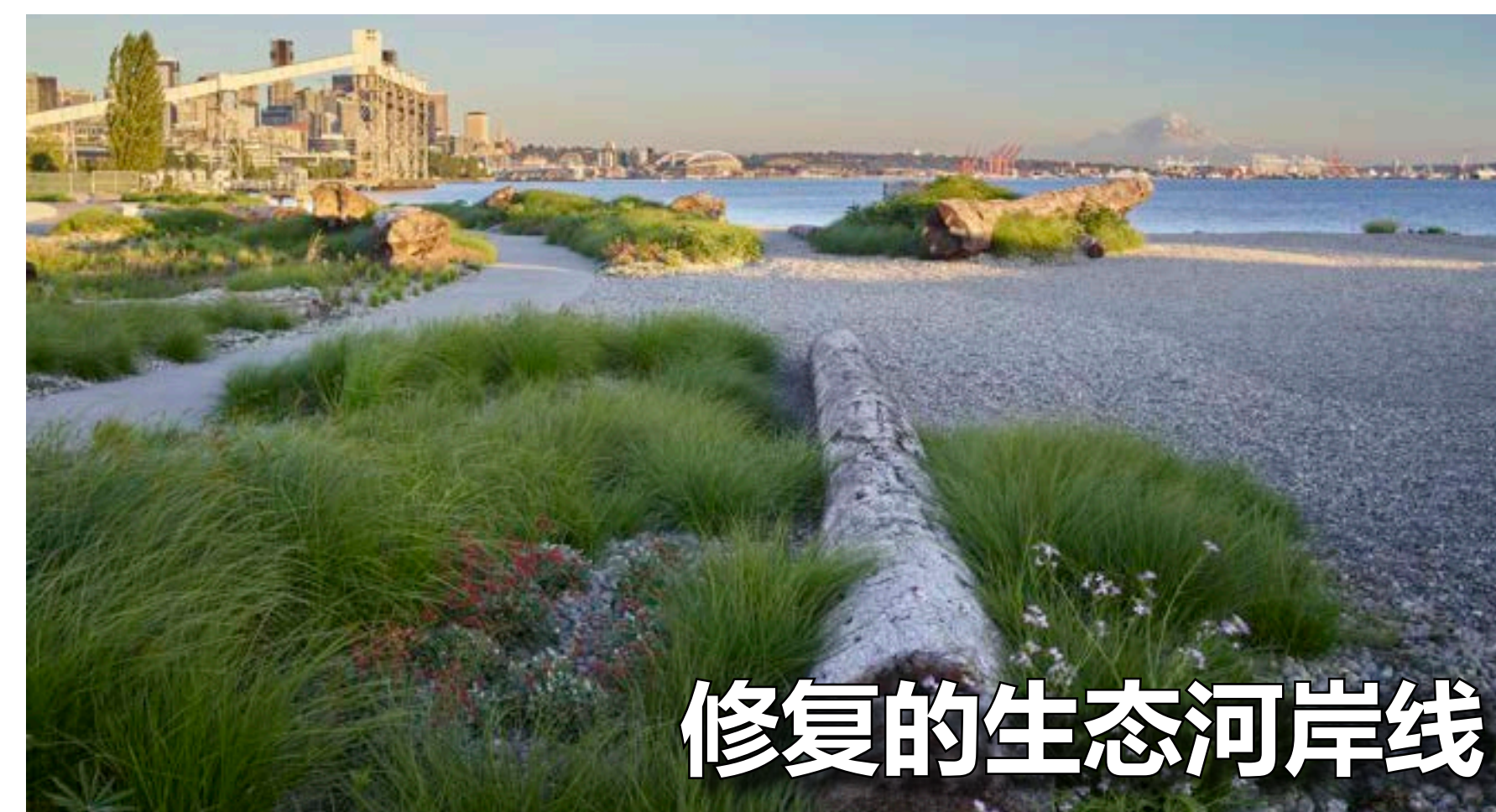
修复的生态河岸线