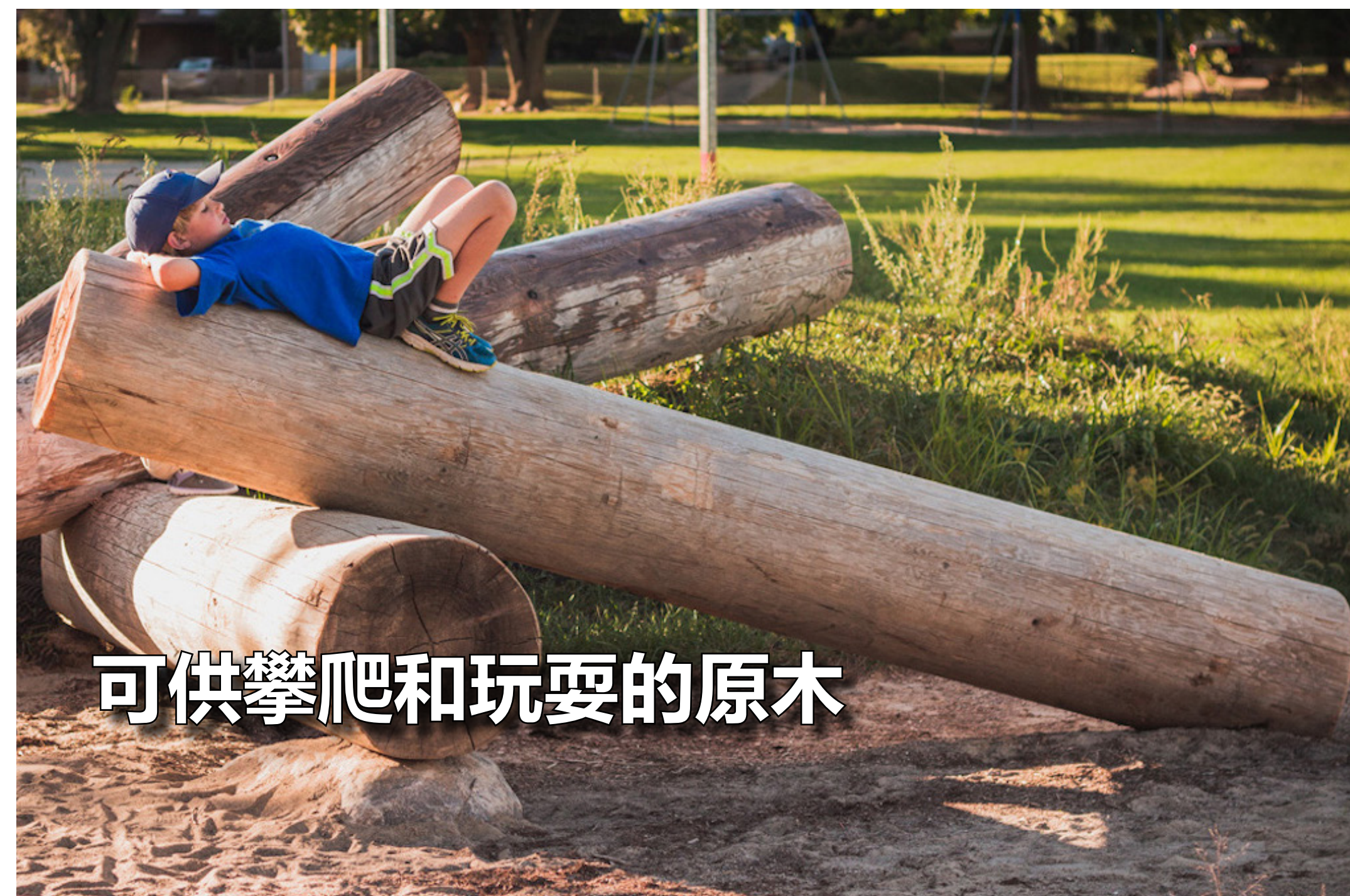
可供攀爬和玩耍的原木