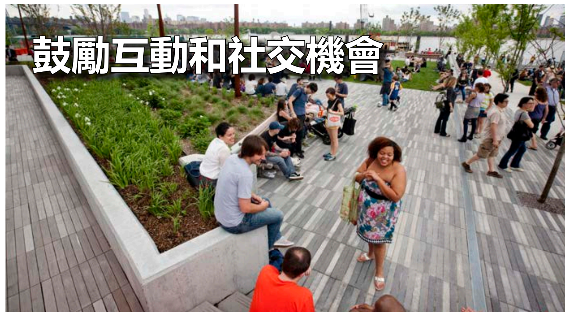
鼓勵互動和社交機會