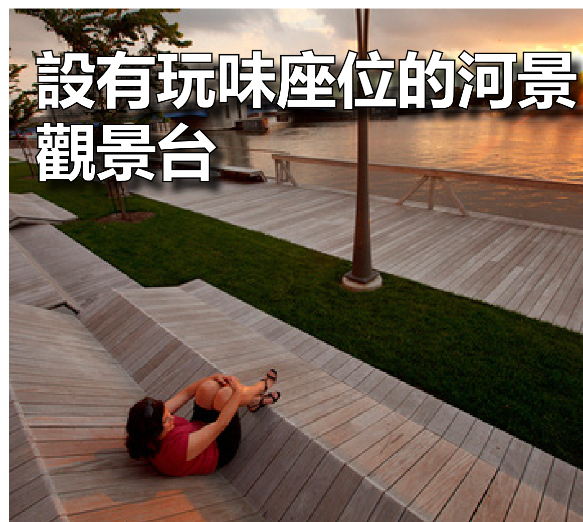
設有玩味座位的河景 觀景台